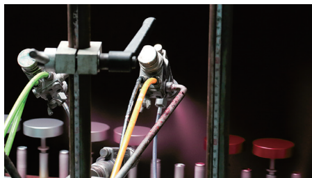
トップコート工程